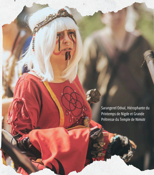
Sarangere! Odval, Hiérophante du Printemps de Nigde et Grande Prêtresse du Temple de Nimotr

Ensuite, on retrouve les Oracles : il s'agit d'un titre donné aux cyclaires pourvus de visions prophétiques ainsi que de talents en médecine et alchimie, à l'intérieur des villages ancestraux. Ils sont reconnus comme ayant un contact plus approfondi auprès des Quatres et agissent donc comme dirigeant politique et spirituel au sein de ces communautés.