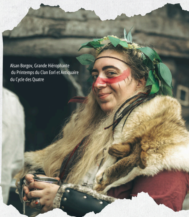
Alsan Borgov, Grande Hiérophante du Printemps du Clan Eorl et Antiquaire du Cycle des Quatre

De manière plus générale, un pratiquant des voies du cycle sera appelé prêtre ou prêtresse au sein de sa communauté. Certaines grandes villes ont même érigé des temples et ont leur propre ordre voué au Cycle des Quatres : les dirigeants de ces temples seront, dans la plupart des cas, appelés Grand Prêtre ou Grande Prêtresse . Ils demeurent soumis aux autorités supérieures religieuses, mais peuvent se dévouer à la vénération de sylphes régionaux ou à un aspect des Quatres.